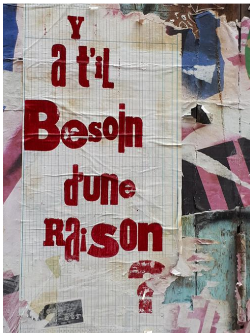
Question - Street art, Valence (Espagne), février 2023.

la revue électronique de l'Institut de recherche et d'information sur le volontariat- www.iriv.net - numéro 50 – mai 2026 – questions